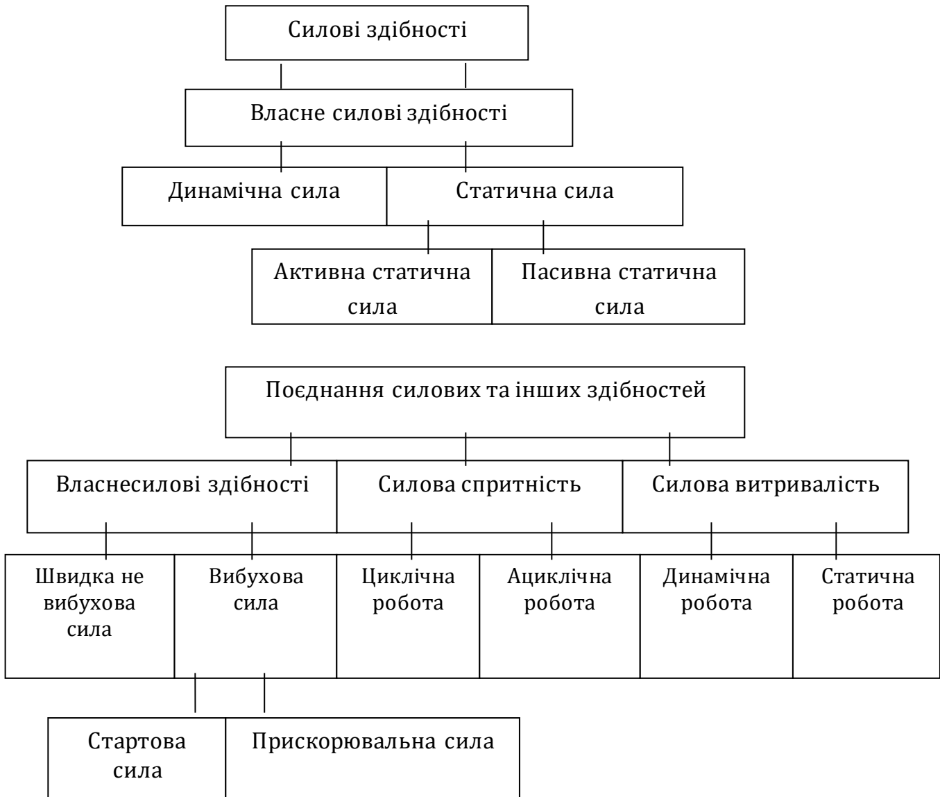
Рис. 2. Силові здібності, їх форми і типи прояву

ваги спортсмена, коли нібито насильно розтягується напружений м'яз.